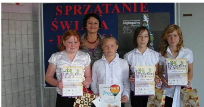
Laureaci ze SP w Miłaczewie

Organizatorami kampanii są Stowarzyszenie Producentów i Dziennikarzy Radiowych w Poznaniu oraz Fundacja „Trzeźwy Umysł”. W ramach kampanii w szkołach podstawowych i gimnazjum odbyły się po 2 konkursy pt. „Życzę sobie” i „Dwa kółka”, a w gimnazjum „Życzę Tobie” i „Na dwóch kółkach”. Po zebraniu prac konkursowych (tj. literackich i plastycznych) Gminna Komisja ds. Profilaktyki i Rozwiązywania Problemów Alkoholowych w Malanowie 24 czerwca br. wyłoniła 23 laureatów ze szkół podstawowych i 6 z gimnazjum, a następnie wszystkie prace konkursowe zostały wysłane do organizatorów kampanii.