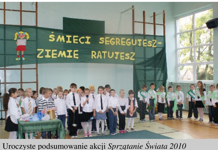
Uroczyste podsumowanie akcji Sprzątanie Świata 2010

Były wiersze, piosenki, przedstawienie ekologiczne klas drugich oraz dyplomy uznania dla uczniów, którzy wyróżnili się w licznych konkursach. Celem wszystkich podjętych działań było kształtowanie świadomości ekologicznej, dostrzeganie piękna i naturalnych darów Ziemi, współpraca w grupie oraz umiejętność prezentacji i umożliwienie uczniom wykazania się pomysłowością i talentem twórczym. Akcja Sprzątanie Świata w naszej szkole cieszyła się dużym zainteresowaniem wśród uczniów dzięki zaangażowaniu wszystkich nauczycieli, którzy włączyli się w propagowanie treści proekologicznych.