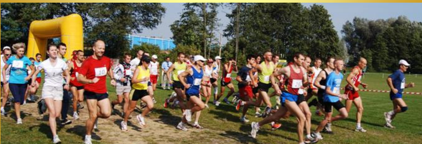
W Biegu Głównym wystartowało 44 zawodników w tym 7 z gminy Malanów.