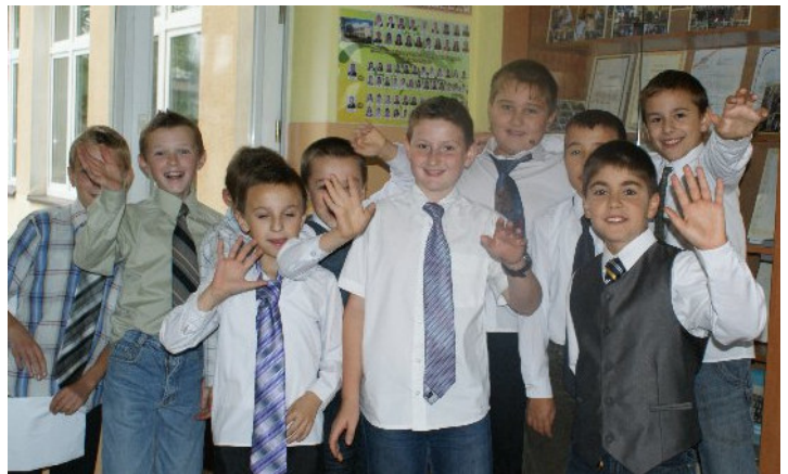
Z okazji Dnia Chłopca wszyscy panowie założyli krawaty

Finał akcji Sprzątanie Świata – Polska 2010 w tym roku szkolnym zbiegł się z inną ważną uroczystością, mianowicie z Dniem Chłopca, który obchodzony jest co roku