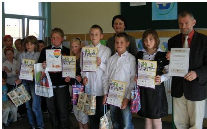
Laureaci ze SP w Kotwasicach