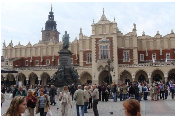
Uczestnicy wyjazdu na Rynku Głównym w Krakowie

Pierwszego dnia po przyjeździe do Krakowa uczestnicy projektu wraz z przewodnikiem zwiedzali krakowski Kazimierz, plac Wolnica, kościół na Skałce, synagogi, dawny rynek żydowski, Wielką Mykwę, Rynek Główny i Sukiennice. Po obiadokolacji uczestnicy projektu