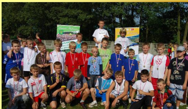
Chłopcy startujący w kategorii klas III-IV