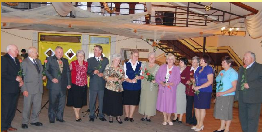
Nowi członkowie Stowarzyszenia Emerytów

Gminne Centrum Kultury i Sportu w Malanowie