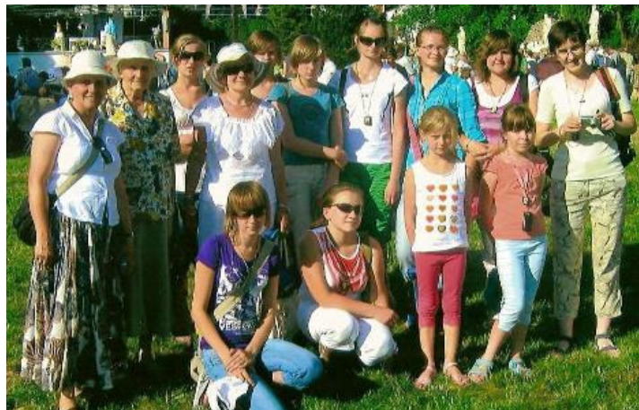
Uczestnicy wakacyjnej pielgrzymki ze świetlicy parafialnej

Rok szkolny 2010/2011 w świetlicy będzie przebiegał pod hasłem „Razem dążymy do świętości”. Inspiracją dla nas staną się święci, których żywoty poznamy na spotkaniach. Program zajęć ma przygotować nas do pielgrzymki religijno-patriotycznej, którą planujemy odbyć w maju do Warszawy. Świętymi z którymi chcemy się zaprzyjaźnić to: św. Andrzej Bobola, św. Maksymilian Kolbe, św. Wincenty Pallotii, bł. ks. Jerzy Popiełuszko, bł. ks. Józef Stance oraz kandydaci na ołtarze Sługa Boży Jan Paweł II i Kard. Stefan Wyszyński. Dla nas, wychowawców świetlicy, ważne w wychowaniu młodzieży jest prowadzenie chłopców i dziewczęta do dobrego, uczciwego życia, którego celem ma być osobista świętość. Inspirowanie do dobra i piękna to cel wszelkich działań wychowaw-