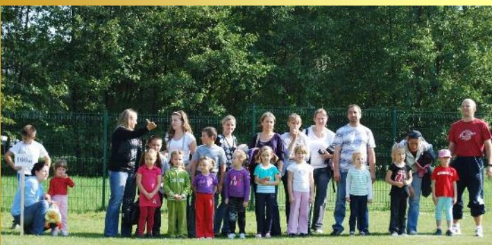
Dziewczynkom z przedszkola dopingowali rodzice

Po ceremonii otwarcia przyszedł czas na rozpoczęcie rywalizacji w poszczególnych kategoriach dzieci i młodzieży. Ku radości organizatorów okazało się, że wszystkie kategorie są bardzo licznie obsadzone, a łącznie do biegów zgłosiła się rekordowa liczba 162 uczestników. Tradycyjnie, jako pierwsze na linii startu ustawiły się przedszkolaki. Ich wyścig na 100 m dostarczył zarówno im, jak i dopingującym swoje pociechy rodzicom dużo emocji i radości.